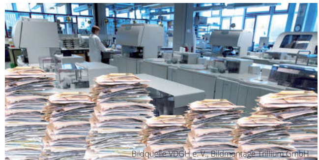
Bildquelle VDGH e. V., Bildmontage Trillium GmbH